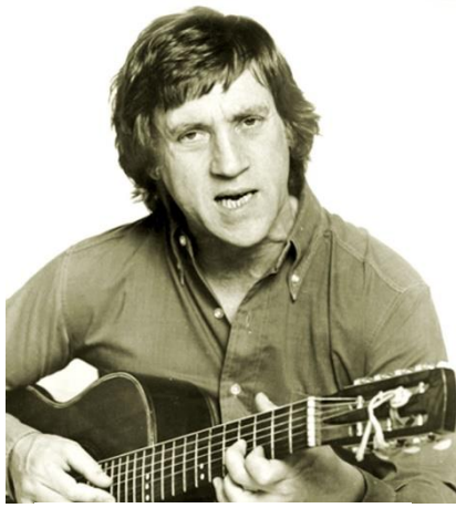
В. С. Высоцкий 1938-1980