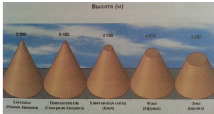
Рис. 2. Диаграмма самых высоких действующих вулканов

Критерии оценки: оригинальность, красочность, аккуратность, сложность выполнения.